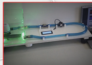
СИСТЕМА ГЕНЕРИРОВАНИЯ ЭЛЕКТРОЭНЕРГИИ НЕАТОМНЫХ ПОДВОДНЫХ ЛОДОК НА ОСНОВЕ МАГНИТОГИДРОДИНАМИЧЕСКОГО ЭФФЕКТА.