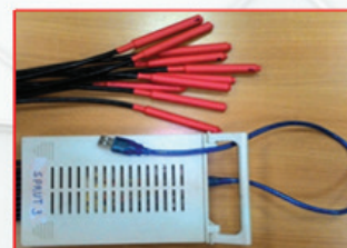
СИСТЕМА РЕГИСТРАЦИИ И ХРАНЕНИЯ ДАННЫХ О ТЕМПЕРАТУРЕ СРЕДЫ.