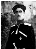
Врангель Петр Николаевич (1878–1928)