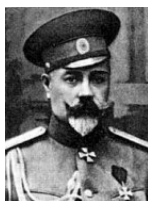
Деникин Антон Иванович (1872–1947)