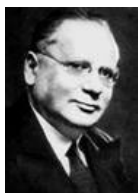
Литвинов Максим Максимович (1876–1951)