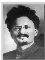
Троцкий Лев Давидович (1879–1940)