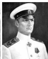
Колчак Александр Васильевич (1874–1920)