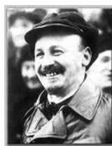
Бухарин Николай Иванович (1888–1938)