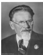
Калинин Михаил Иванович (1875–1946)