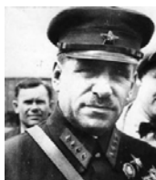
Блюхер Василий Константи- нович (1890–1938)