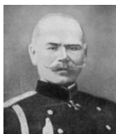
Алексеев Михаил Васильевич (1857–1918)