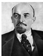
Ульянов Владимир Ильич (псевдоним Ленин) (1870–1924)